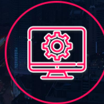
Services, Anwendungen und Frameworks von Drittpartner